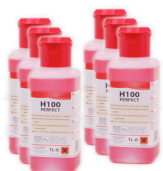
H 100 PERFECT CAIXA 6X1 L