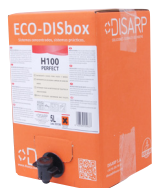
ECO-DISBOX H100 PERFECT BAG IN BOX 5L