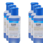
H 200 PERFECT CAIXA 6X1 L