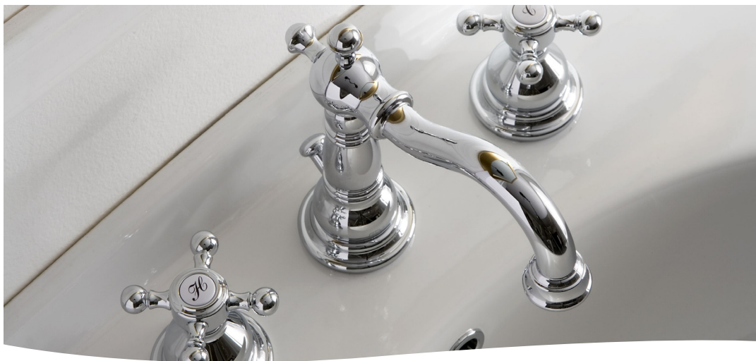
Gama H100 - Detergente diário para casas de banho