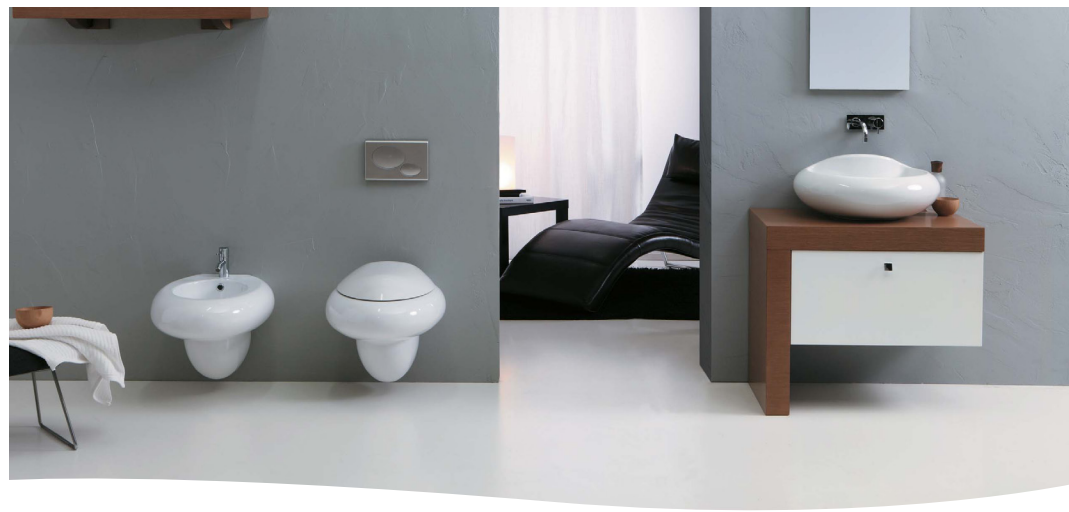
Gama H200 - Detergente diário para interiores