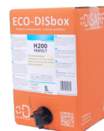
ECO-DISBOX H200 PERFECT BAG IN BOX 5L